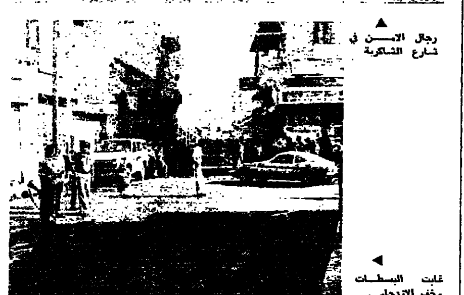
غابت البسطة وخف الزحام